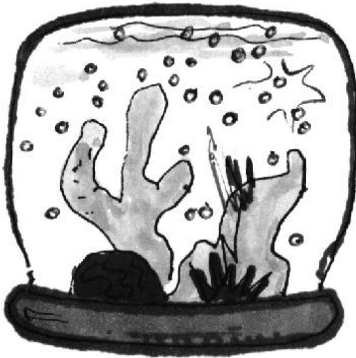
Frasco de “tormenta de nieve” hacia arriba

Provea a cada estudiante un frasco limpio de comida para bebés. Pida a los estudiantes que creen arrecifes de coral en miniatura usando goma espuma (“ styro-foam ”), papel encerado, papel de aluminio, cinta adhesiva de color, palillos de dientes, limpiadores de pipas, cuentas de colores y otros materiales. Los corales pueden ser coloreados con pintura a prueba de agua y marcadores permanentes. Haga que los estudiantes fijen sus corales a las tapas de los frascos utilizando plasticina de modelar (o una pistola de pega, usada bajo supervisión del maestro). Llene los frascos de comida de bebés con agua teñida de azul con colorante de alimentos. Añada una cantidad pequeña de escarcha plateada a cada frasco y luego cierre con la tapa, sellándola por fuera con cemento de goma. Haga que los estudiantes viren los frascos (de tal manera que el arrecife esté abajo) y suavemente agite el frasco para simular el desove de los corales.